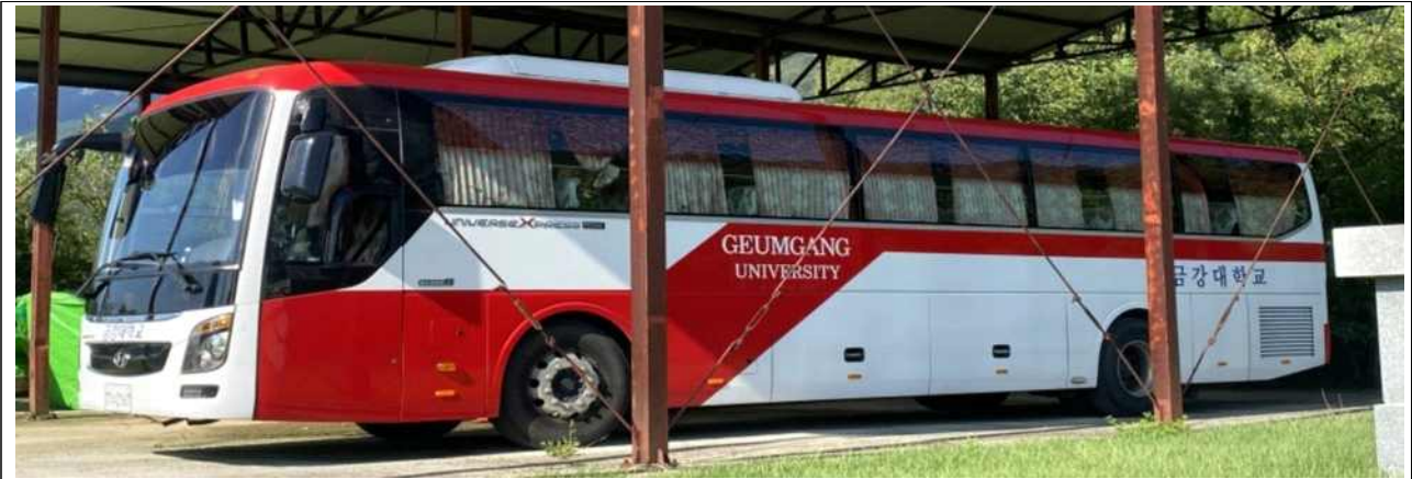
□ 대전역 탑승장소: S-OIL 동광장 주유소 맞은편