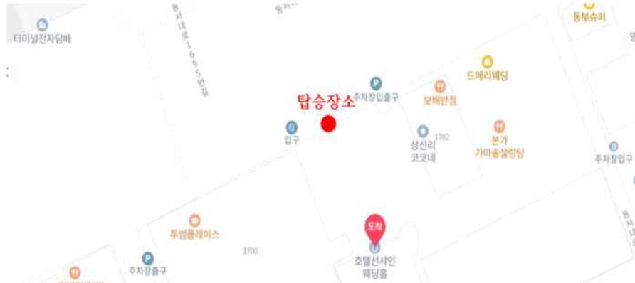
□ 대전복합터미널 탑승장소: 선샤인 웨딩홀 앞

02.25.(수): 14:30 03.01.(일): 14:30 03.02.(월): 14:30